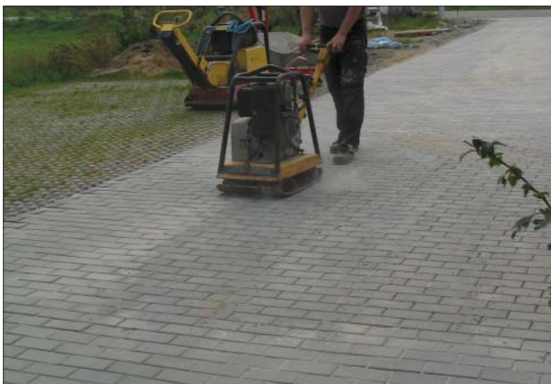
Høj frekvens er afgørende for at en 200 kg vibrator kører godt. Læg i øvrigt mærke til den tydelige forskel på det vibrerede og ikke-vibrerede areal.

Disse anbefalinger gælder kun vibrering af sten (længde/tykkelse < 4). Stenene skal lægges på ikke-komprimeret afretningslag. Med de store vibratoren, der anvendes, giver det en optimal komprimering af