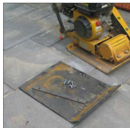
Kunststofpladerne er fremstillet af PEHD. Andre typer kan også anvendes.