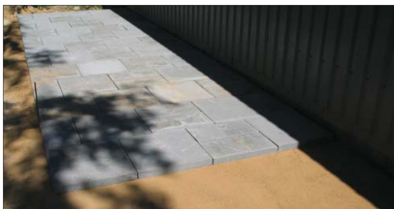
Flisebelægningen er opbygget på traditionel vis med 15 cm bundskringgrus, 12 cm stabilt grus og 3 cm afretningslag. Læggemønstret er lavet så de to formater er jævnt fordelt mellem hinanden.

Pladevibratørene er afprøvet med og uden kunststofplade. Konklusionen er, at der skal anvendes kunststofplade for at undgå skader. Endvidere er kun vibrator nr. 1 og 2 velegnet. Nr. 3 og 4 giver, selv med kunststofplade, skader på fliserne.