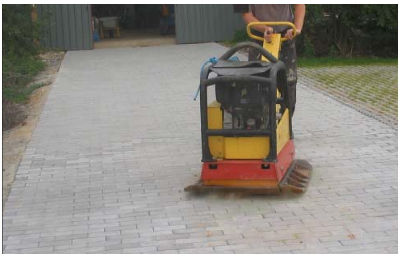
Store vibratorer, som her på 500 kg, kan udmærket anvendes, blot de anbefalede krav til centrifugalkraft og frekvens overholdes.

¥ vægt: 500 kg ¥ centrifugalkraft: max. 200 kN/m 2 ¥ frekvens: min. 60 Hz.